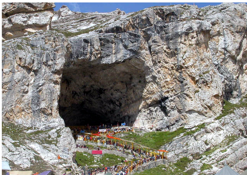
Святая пещера Амарнатх

Департамент туризма штата построил здание для проживания паломников на различных станциях по маршруту к святой пещере. Несколько частных лиц также установили палатки с удобствами для проживания.